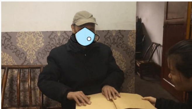
老人在为大家朗读盲文故事

2018年11月13日，基金会工作人员一行前往望麓社区援助对象家中，几位老人自小双目失明，并且患有高血压、腔隙性脑梗塞、冠心病等疾病，经常需要住院疗养。湖南省人口健康福利基金会了解并核实了情况后，对他们住院期间的医疗费用自费部分进行了全额救助，极大减轻了老人的医疗费用负担。