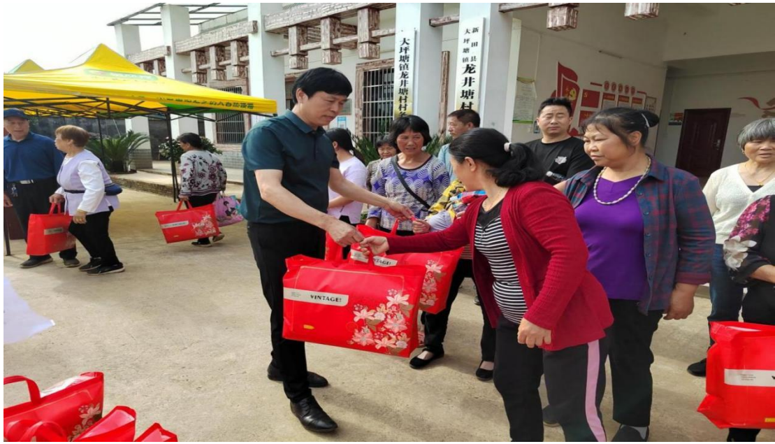
向困境母亲发放被子