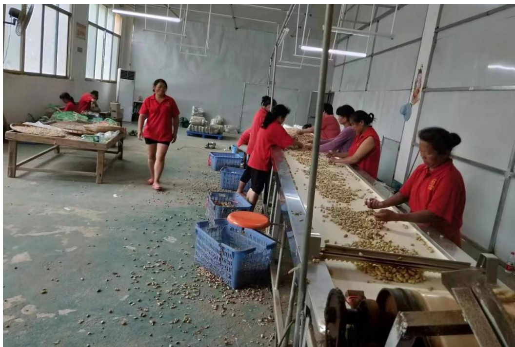
受助母亲在进行花生加工