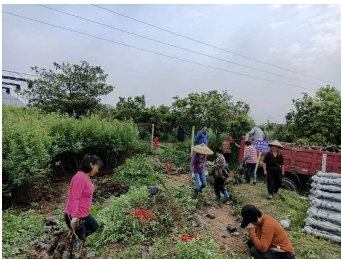
项目受助母亲在蓝莓基地务工

2. 举办了 2 期蓝莓种植技术培训班，组织项目受助母亲家庭成员参加免费培训，参训 75 人次。