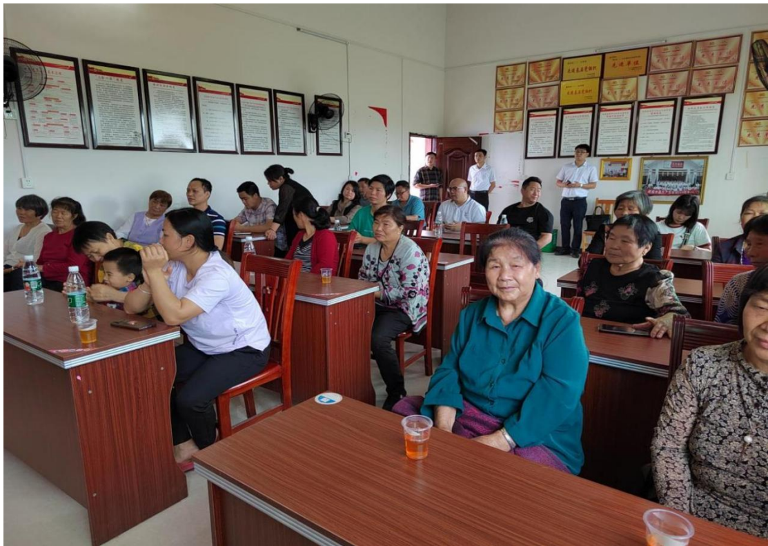
举办“庆祝第二十七届母亲节”座谈会