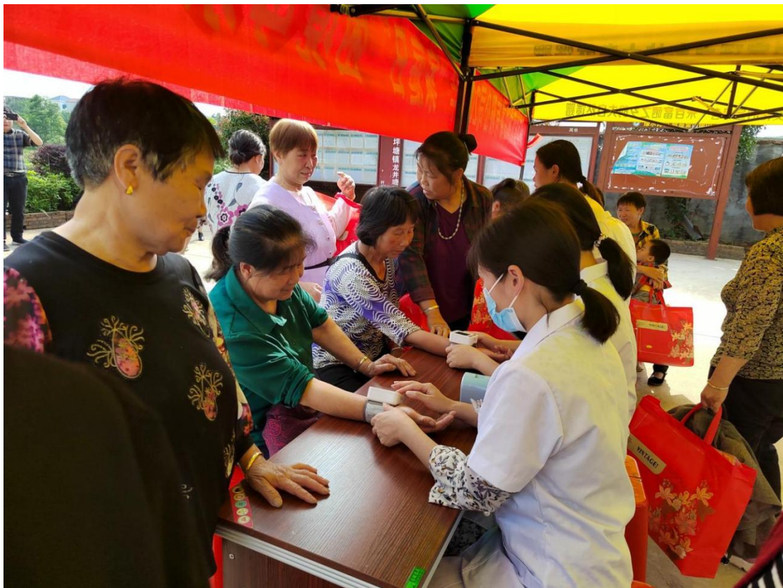
为困境母亲开展义诊活动