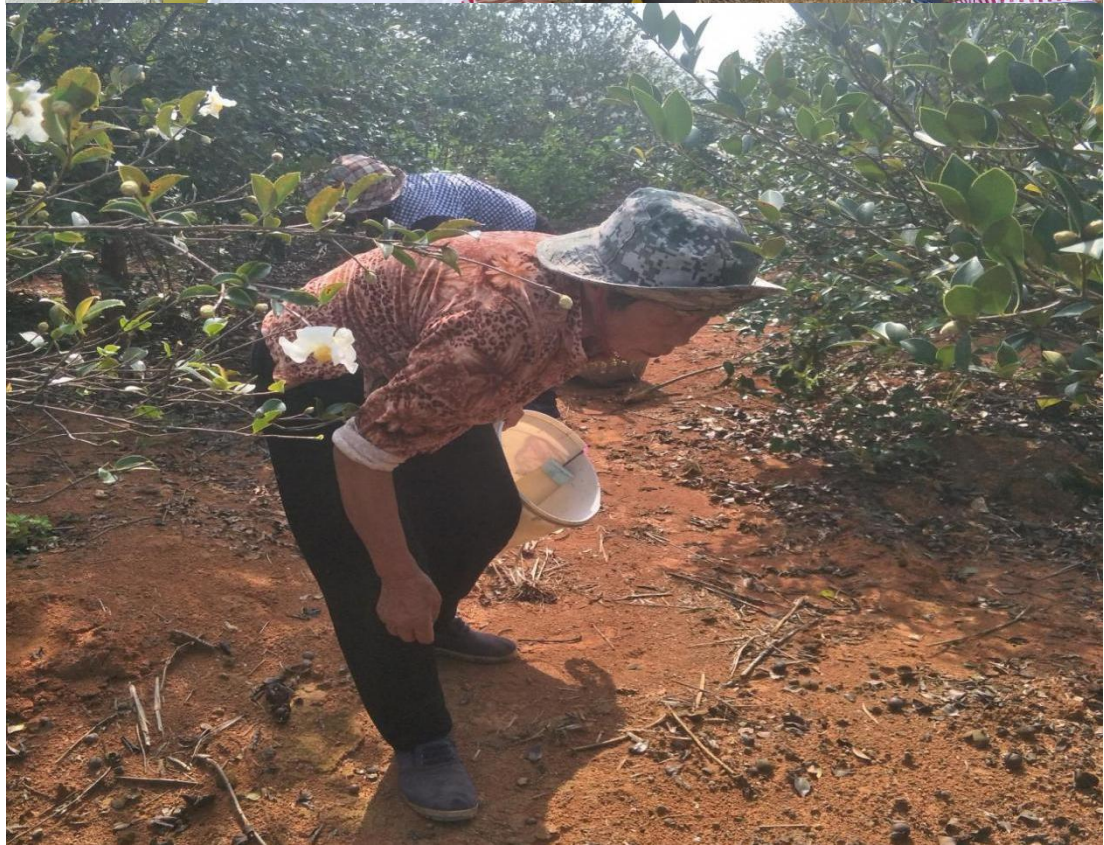
聘请困境母亲及家属到油茶基地施肥