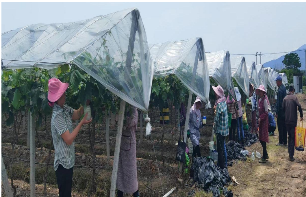
受助母亲在管理葡萄

项目合作企业优先录用受助母亲开展葡萄种植、花生加工，每人每天发放 200 元务工费，解决就业问题，增加收入。