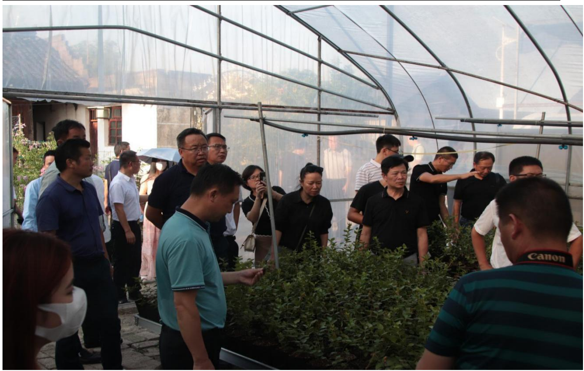
项目受助母亲家庭代表参加蓝莓栽培技术免费培训