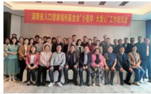
▲基金会在常德市召开“小善举·大爱心”工作座谈会