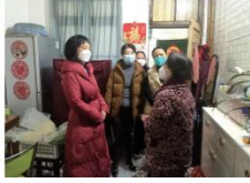
株洲市人民政府副市长、党组成员钟震元进行“小善举·大爱心”慰问