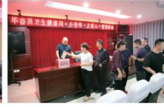
▲岳阳市华容县卫健局、计生协开展卫健系统“小善举·大爱心”募捐活动