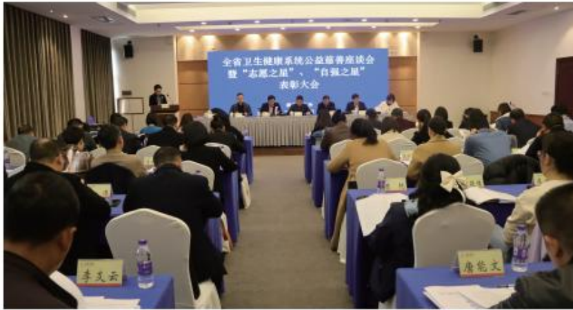
▲基金会在长沙召开全省卫生健康系统公益慈善座谈会暨“志愿之星”、“自强之星”表彰大会