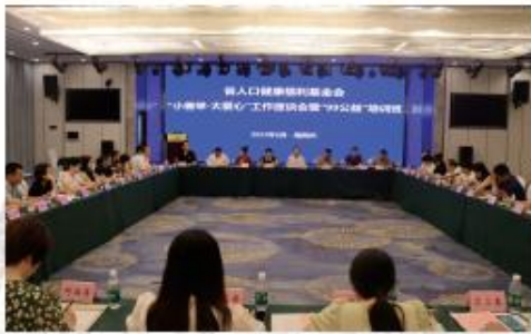
▲基金会在湘西州召开“小善举·大爱心”工作座谈会暨“99公益”培训班