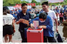
▲邵阳市邵东市开展“小善举·大爱心”募捐活动