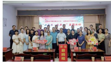
▲益阳市卫健系统开展“小善举·大爱心”募捐活动