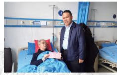
▲邵阳市卫健委党组书记、主任，市委卫生健康工作委员会委员、市卫健委党组书记一行慰问困难职工