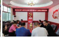
▲南阳市南阳市开展“小善举·大爱心”募捐活动