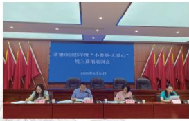
▲常德市组织开展“小善举·大爱心”线上募捐培训会