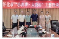
▲怀化市“小善举·大爱心”工作座谈会